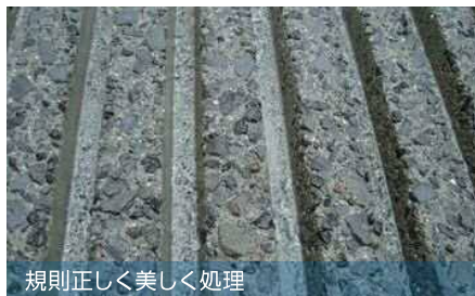
規則正しく美しく処理