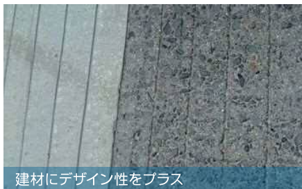
建材にデザイン性をプラス

無機的なテイストに、個性ある表情をプラス。新しい加工アイデアが建築ニーズの幅を広げます。PC板の段階で加工を施します。加工の形状や程度、骨材との組み合わせなど、方法についてご相談ください。