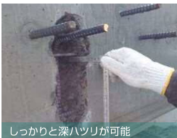
しっかりと深ハツリが可能