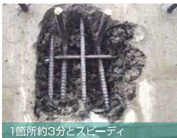
1箇所約3分とスピーディ