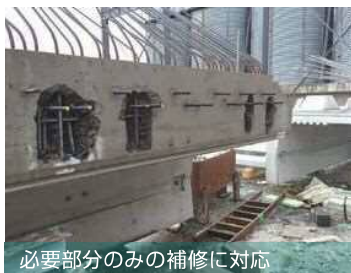
必要部分のみの補修に対応

水の噴射だから低振動。鉄筋出しなど コンクリート板の部分補修・深ハツリに最適!!